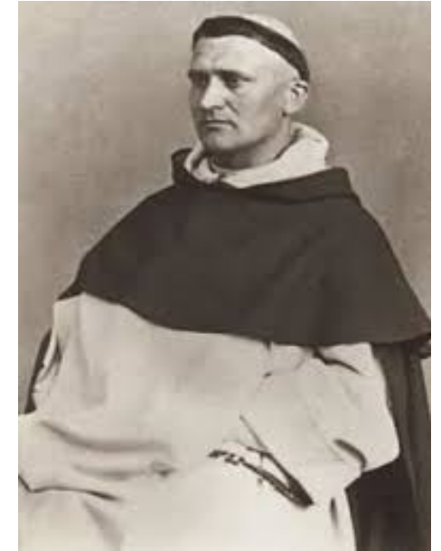
Beato João José Lataste

Papa Bento XVI o declara bem-aventurado a 3 de Junho de 2013.